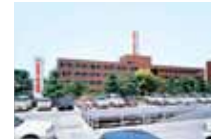
阪和第二泉北病院

阪和インテリジェント医療センターは錦秀会グループの病院をはじめ、多くの専門医療機関と連携し、万全の体制でフォローいたします。