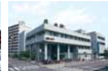
阪和住吉総合病院