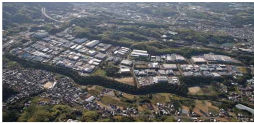
▲テクノステージ和泉（全景）：大阪府下の郊外型工業団地としては有数の規模を誇る。和泉市内はもちろん、泉大津市、岸和田市、高石市、堺市、大阪市など、市外からの通勤者も少なくない。和泉商工会議所も所在している