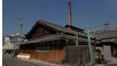
▲佐竹ガラス：日本で唯一戦前から続く工芸用色ガラス棒の生産工場。建物は国の登録有形文化財に指定