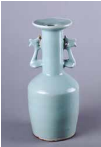
▲青磁 鳳凰耳花生（ほうおうみみはなひけ）銘万声（めいばんせい）中国・南宋時代（久保惣記念美術館所蔵） ▲重要文化財「枯木鳴鶴図」宮本武蔵筆（久保惣記念美術館所蔵）