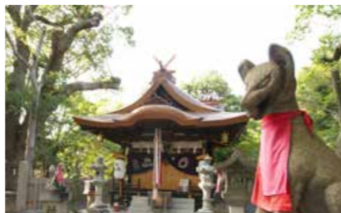
▲葛葉稲荷神社：正式名称は、信太森神社。陰陽師・安部晴明が信太の森の白狐を母として生まれたという「葛葉伝説」の舞台