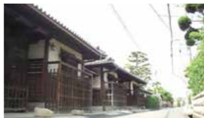
▲熊野街道（小栗街道）：京都から大阪を経由して紀伊熊野へと通じる熊野詣での道