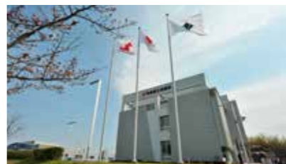
▲和泉商工会議所新会館：平成25年4月に移転。和泉市産業振興プラザ北館が入居。より身近で機能的な商工会議所として市と連携して地域経済発展に努めている