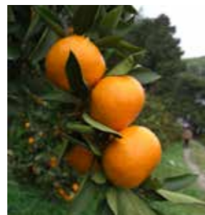
▲和泉みかん：市内南部の丘陵地区で主に栽培されている。和泉市は大阪府内最大のミカンの産地