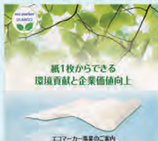
エコマーカー事業のご案内

機密文書などの安全な処理により、日々のシュレッダー処理の手間を省き、細断古紙は焼却せず製紙原料会社へ回収され、再生品としてリサイクルすることにより、CO 2 発生を抑制し、地球温暖化防止に貢献でき、環境貢献企業としての役割が果たせます。