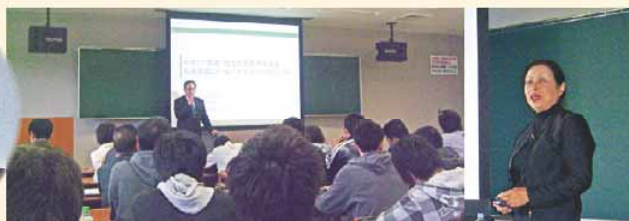
桃山学院大学での講義風景

講義には一般市民の無料参加が可能です。尚、履修学生が優先となりますので満員の折にはご容赦下さい。