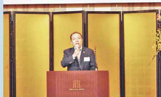
西辻代表幹事開会挨拶