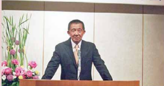
村井会長開会挨拶