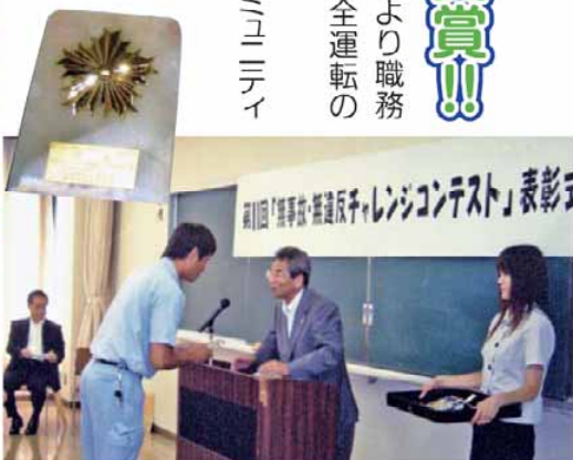
平成21年度表彰式風景

表彰式は7月13日に和泉市コミュニティセンターにて実施。当会議所では、今後とも賞に恥じないよう事業所における安全運転管理を遂行して参る所存です。