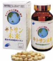
キトサン未来 一般タイプ 650粒入 21,000円

カニ、エビの甲羅から精製された物質です。富中低分子水溶性キトサンは体内で吸収されやすいよう研究された国内特許のキトサンです。全国の多くの方々から愛されて30年…嬉しい体験がたくさん届いています。アトピー・腰痛・交通事故のしびれ・更年期障害・糖尿病・膠原病・透析・耳鳴り・歯槽膿漏・抗癌剤の副作用を抑える・ガン闘病をつづける患者さん達が富中低分子水溶性キトサンでみごとに好転した症例など数多くあります。