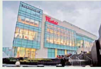
▲欧州最大級のショッピングモール(ウエストフィールド)

また、湖水地方では、イギリスの代表的なロマン派詩人であり、湖水地方をこよなく愛し、純朴で情熱豊かな自然美の詩を書くウィリアム・ワーズワース氏やピターラビットの作者であるヘレン・ビアトリクス・ポター氏の生誕の地を訪問し、その背景などを調査した。