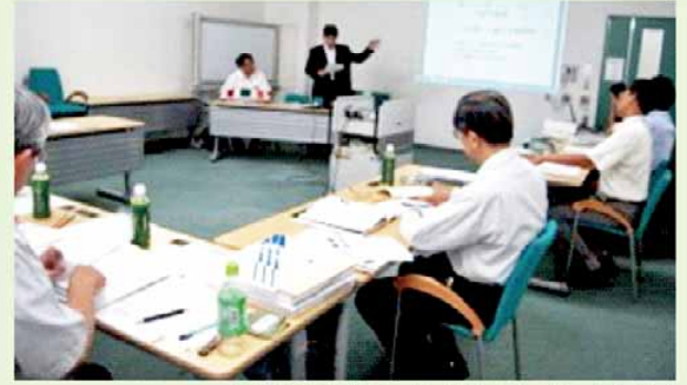
提案者からのプレゼンテーション風景

和泉市内企業においては、テクノロール株式会社、株式会社村上技研産業2社が採択・認定されました。認定された当該プロジェクトは、大阪府産業技術総合研究所の技術相談や設計・試作・実証調査に対する助成金などの支援メニューを活用することができます。