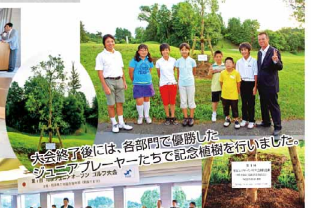
大会終了後には、各部門で優勝したジュニアプレーヤーたちで記念植樹を行いました。