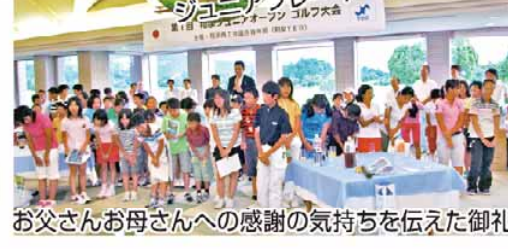
お父さんお母さんへの感謝の気持ちを伝えた御礼