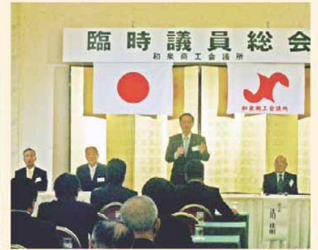
臨時議員総会の様子