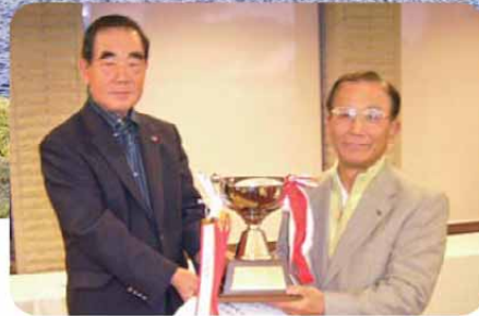
原 委員長から優勝カップの授与