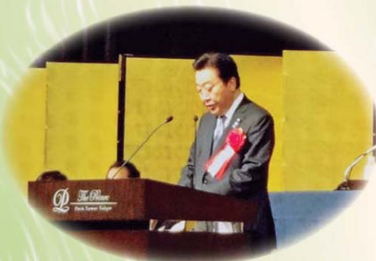
あいさつする野田佳彦内閣総理大臣

日本商工会議所の第116回通常 会員総会・会員大会が9月20日 (木)に東京都港区芝公園のザ・ プリンスパークタワー東京で開 催され、1,000名を超える 参加のもと午前9時より始ま り、日本商工会議所の岡村正会 頭挨拶、ご来賓の野田佳彦内閣 総理大臣、枝野幸男経済産業大 臣のご挨拶に続き、当所の岸脇 淳介会頭が登場しました。一昨 年から「国際開発特別委員会」 で実施している中国の共同買付 事業が、日商表彰規則「商工会 議所表彰/事業活動」により日 商會頭表彰を受賞しました。