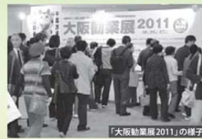
「大阪勧業展2011」の様子

前回来場者の声 ●来場者数:8,459人 ●出展者数:299企業・団体 ●商談件数:3,007件 ★出展企業・来場者とも数多く、とても活気があった。★新たな取引先の発掘ができた。 ★熱心に商談をされており、在販企業のパワーを感じた。★効率的に情報収集ができて良かった。