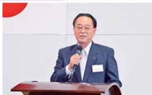
岸協会頭開会挨拶