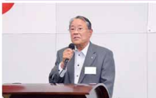
大宅副会頭閉会挨拶