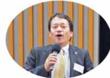
前川副会長による単会PR