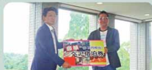
優勝者への賞品授与