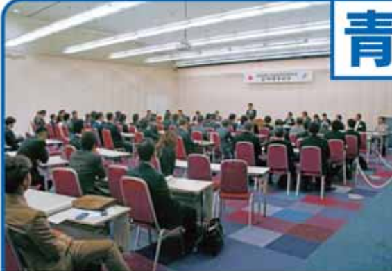
定例理事総会 風景