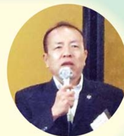
西辻代表幹事 挨拶