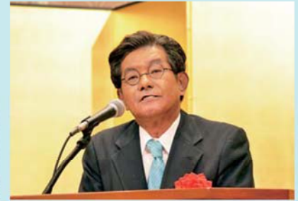
中川 前衆議院議員