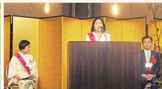
本山実行委員長 挨拶