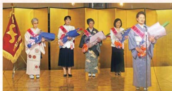
歴代会長へ花束贈呈