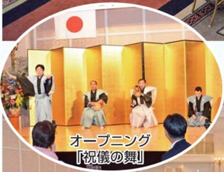
オープニング 「祝儀の舞」