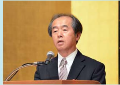
近畿経済産業局長 代理 須山産業部長