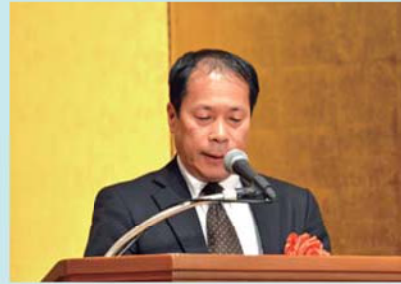
大阪府知事 代理 船木室長