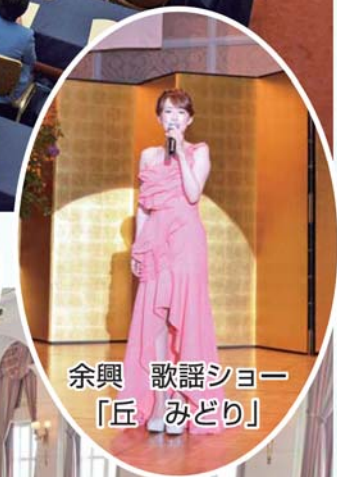
余興 歌謡ショー 「丘 みどり」