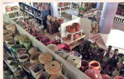
藤製品、木工製品展示工場