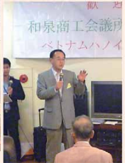
岸協会頭 歓迎お礼の挨拶