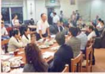
日系企業 自己紹介