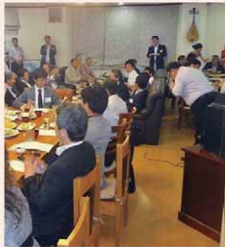
Vinapon development co.ltd 代表取締役 宮田氏 歓迎のご挨拶