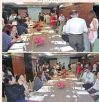
通訳者との行動打合せ