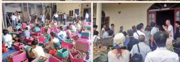
イグサ・藤製品製造工場

【2日目】 ニンビン(キムソン・タムコック・大理石村)(ハノイ市内から一五〇km) 買い付け視察 キムソンにてイグサ・藤製品工場の視察、タムコックにて刺繍工場の視察、ニンビンでは大理石加工現場を視察し、現地の製品製造工程と卓越した技術を確認することができました。特に藤製品については、商品種類が非常に多く製造技術の高さを目の当たりにし、オーダーメイド製造依頼の商談交渉を行う等ビジネスに直結する機会となりました。