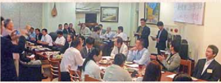
ウエルカムパーティー開宴