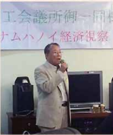
大宅副会頭 国際開発特別委員会担当副会頭 乾杯発声