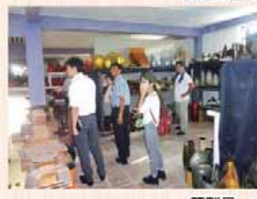
藤製品、木工製品見学