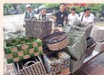
製造工程の説明及び高談