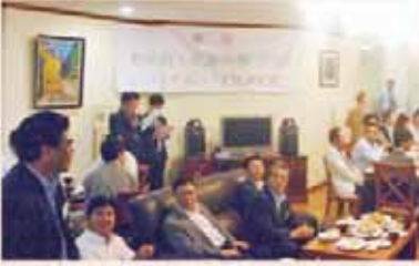
ローカル企業 自己紹介