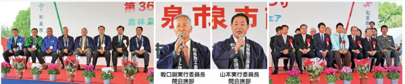
阪口副実行委員長 開会挨拶