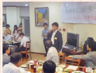
国際開発特別委員会 北野副委員長 お礼の挨拶