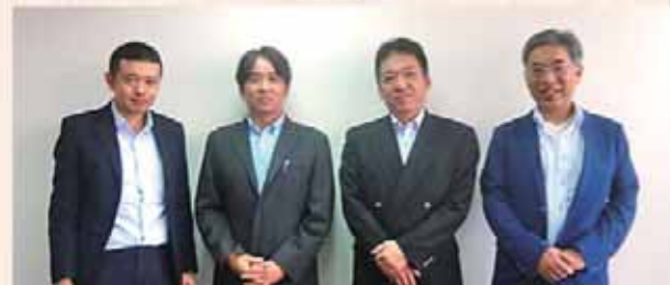
ベトナム日本商工会議所