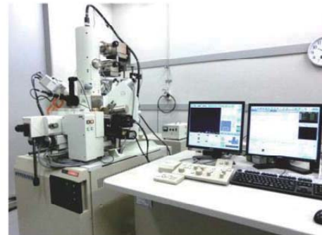
図1. 電界放出形電子プローブマイクロアナライザ (JXA-8530F)

当センターには、一般的な金属特性評価装置のほか、電界放出形電子プローブマイクロアナライザ(FE-EPMA)や反射菊池線回折装置(EBSD)など、最新の金属材料評価装置を配備しており、これら装置を活用した製品開発をご支援いたします。また万一、製品トラブルが生じてお困りの場合には、研究員がその原因解明を支援いたします。