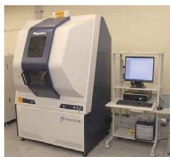
図2. X線回折装置 (SmartLab)