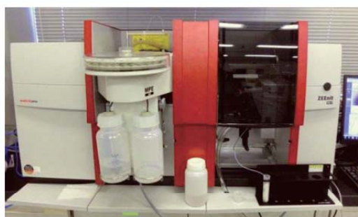
図3. 原子吸光分析装置 (ZEEnit700P)