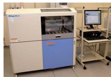
図4. 波長分散型蛍光X線分析装置 (ZSX Primus II)

※ 金属材料に関する評価・解析が行える種々の装置を設置しております。ご自身で試験・分析等を行っていただける、装置等も整えております。詳細につきましては、ぜひお気軽にご相談ください。