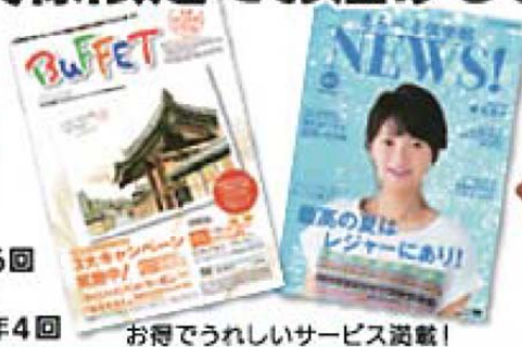
お得でうれしいサービス満載!

従業員数分 パフェプランは年6回 パフェプラン Lite、 えらべる倶楽部は年4回