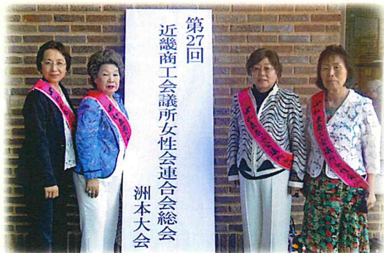
古下会長・岸田副会長・壺井副会長・池辺副会長

平成27年5月21日(木) 第27回近畿商工会議所女性会連合会洲本大会に正副会長4名で参加して参りました。