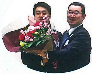
27年度会長から26年度会長へ花束贈呈