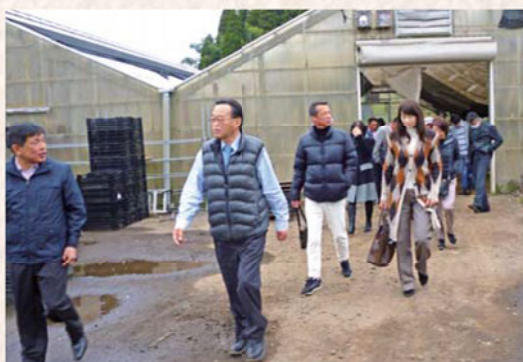
国華園 宮崎農場 視察