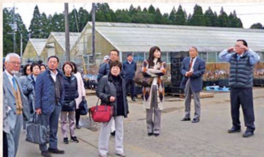
国華園 宮崎農場 視察