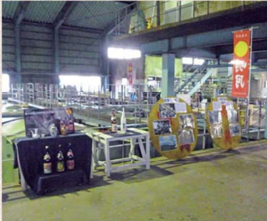
明石酒造 製造工場内