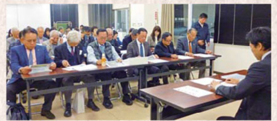
えびの市役所 表敬訪問