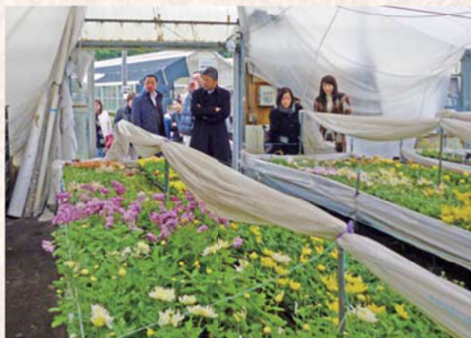
国華園 宮崎農場 視察