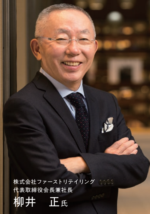
株式会社ファーストリテイリング 代表取締役会長兼社長

各方面で活躍されている方々をお招きし、オンラインによる特別記念講演会を開催します。